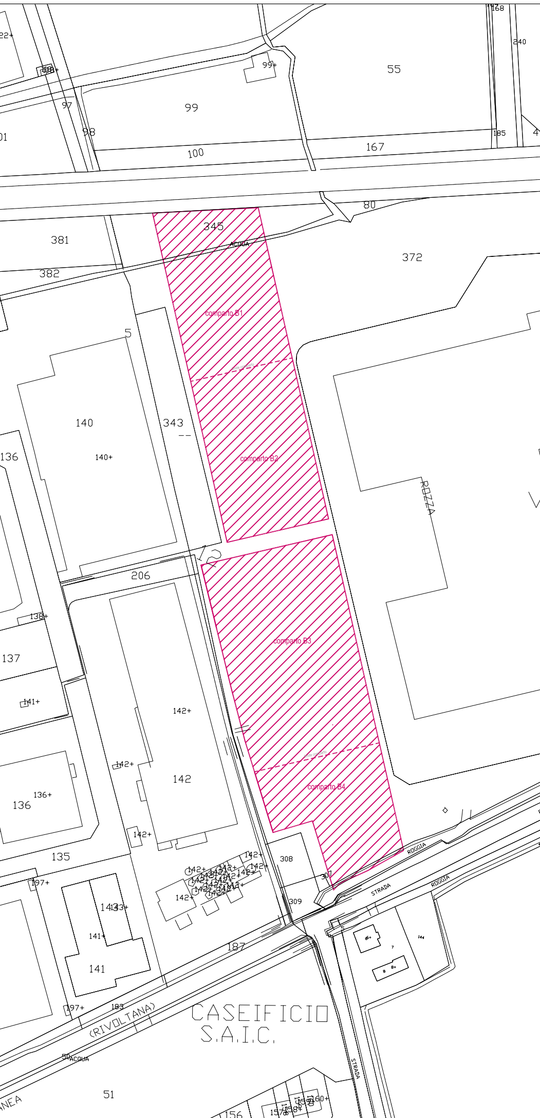
Estratto CATASTALE - 1:2.000